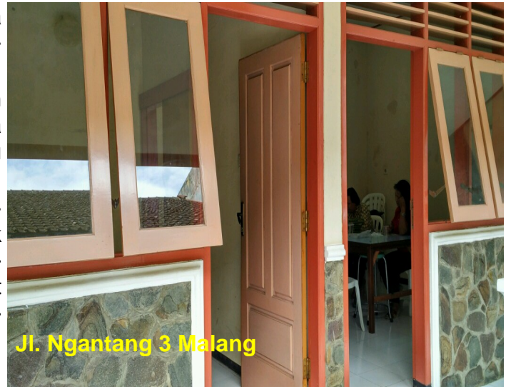
Jl. Ngantang 3 Malang